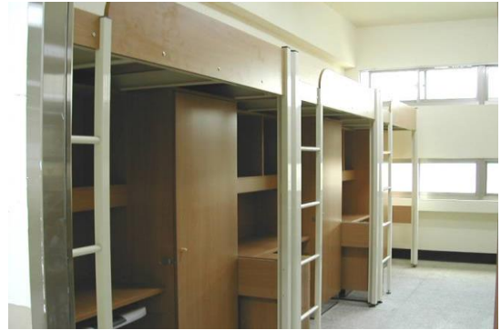
大雅館寢室內部設施