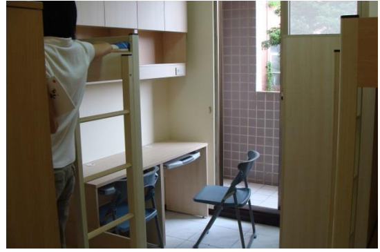
大群館寢室內部設施