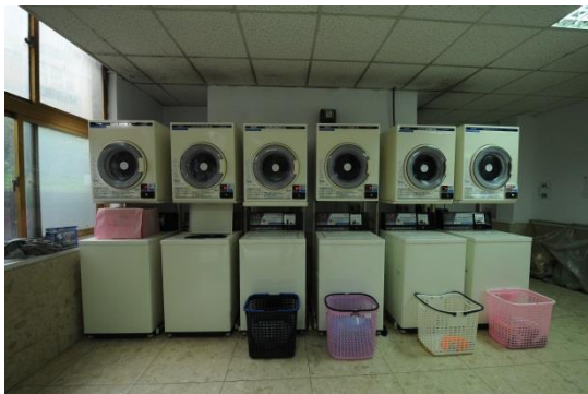
大莊館自助投幣洗衣機、烘衣機