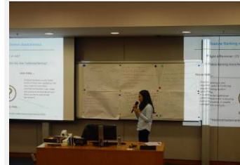
投资理财与证券交易