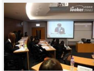
七国集团及金砖四国