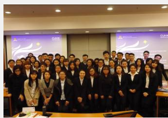
影响力与谈判技巧