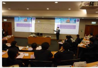
香港银行业与金融市场