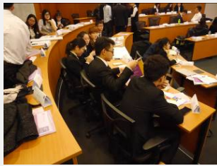
市场营销与品牌管理